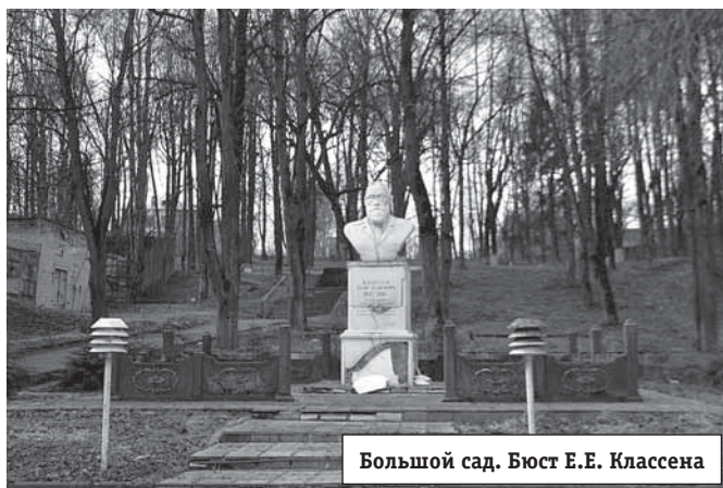
Большой сад. Бюст Е.Е. Классена