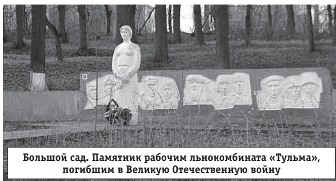
Большой сад. Памятник рабочим льнокомбината «Тульма», погибшим в Великую Отечественную войну

принимала рабочих с различными просьбами и жалобами. Изображение этой беседки сохранилось на фотографии первого пионерского отряда в городе.