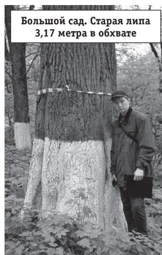
Большой сад. Старая липа 3,17 метра в обхвате